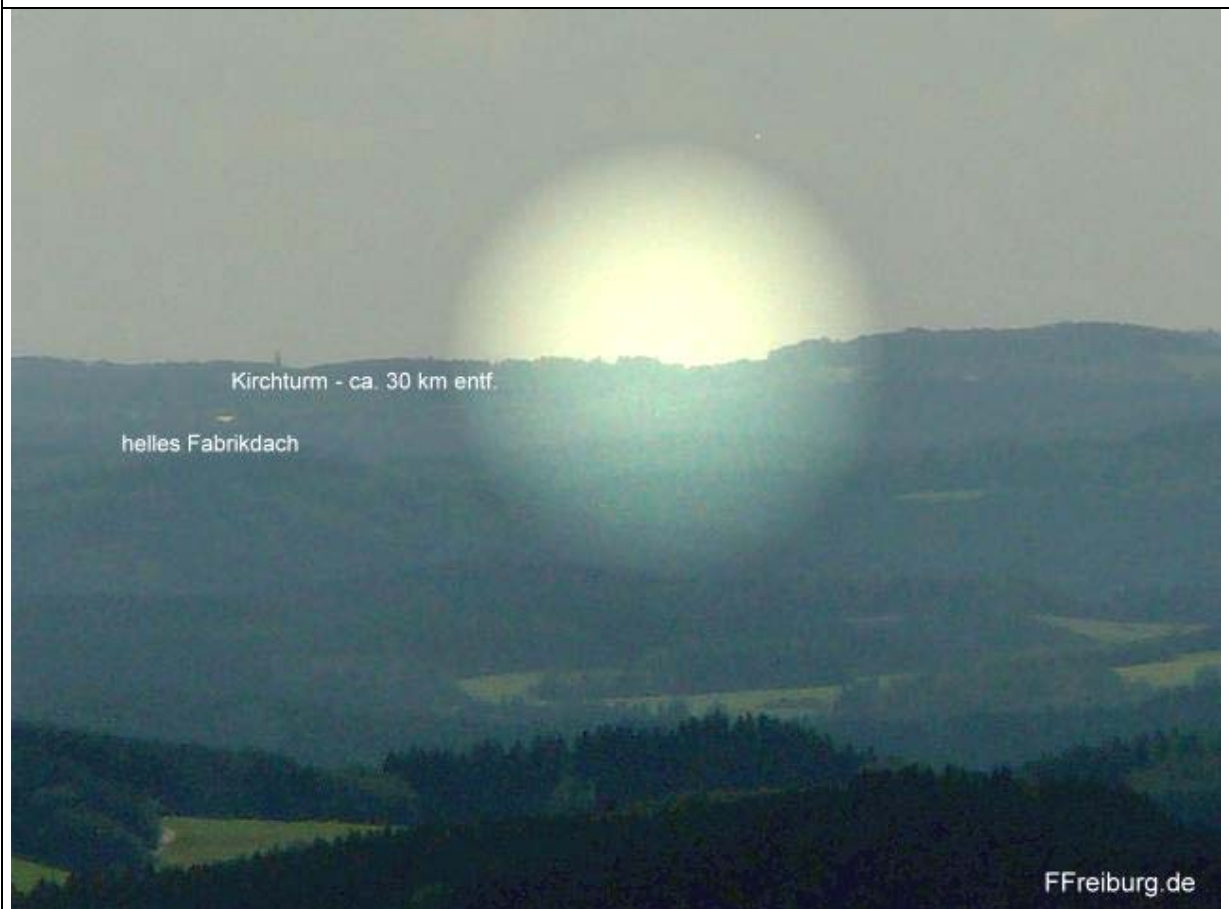
Blick vom Wildewiese-Aussichtsturm in Richtung Südwest zum Siebengebirge mit markiertem Such-Sektor - Markierung am Turm, siehe auch : www.wildewiese.de bzw. www.FFreiburg.de/Wildewiese-Bilder.htm