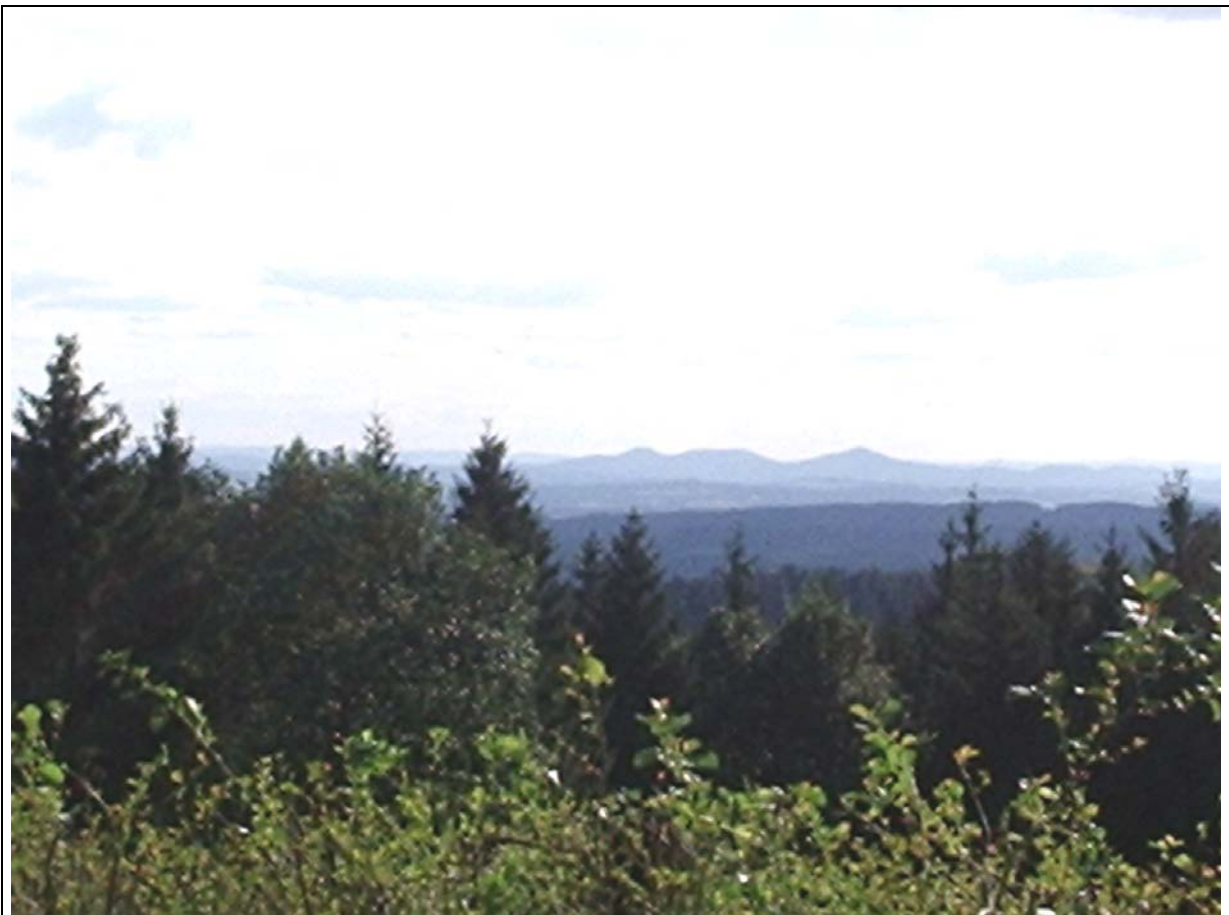
Silhouette des Siebengebirges, von links nach rechts: Löwenburg, Lohrberg, Oelberg